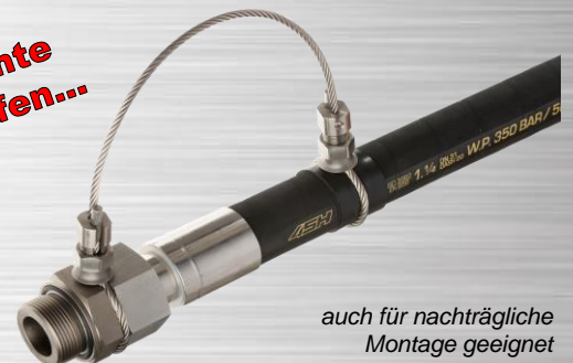
auch für nachträgliche Montage geeignet