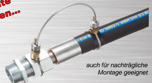
auch für nachträgliche Montage geeignet