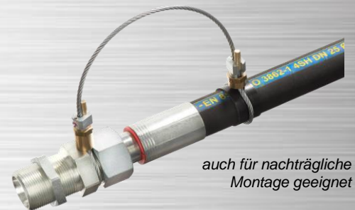
auch für nachträgliche Montage geeignet

Professionelle Schlauchfangsicherung mit 4mm hochfestem Drahtseil und beiderseits zu öffnenden Original-Cablelock-Spannschlössern. Ausführung AS4 ist geeignet für alle gängigen Hydraulikschläuche der Nennweiten DN10 bis DN50 und maßlich passend für die Schlauchtypen* 1SC, 2SC, 1SN, 2SN, 4SP, 4SH, R13, R15. Achtung, DN32 bis DN50 maximal bis Druckstufe 4SP. Passend für alle Armaturentypen nach DIN EN 20066. Weitere wichtige Informationen siehe linke Seite.