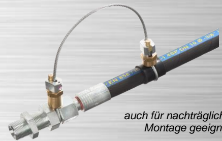
auch für nachträgliche Montage geeignet

Professionelle Schlauchfangsicherung mit 3mm hochfestem Drahtseil und beiderseits zu öffnenden Original-Cablelock-Spannschlössern. Ausführung AS3 ist geeignet für alle gängigen Hydraulikschläuche der Nennweiten DN5 bis DN16 und maßlich passend für die Schlauchtypen* 1SC, 2SC, 1SN, 2SN, 4SP, 4SH, R13, R15. Sondertyp 37A für 700bar-Werkzeughydraulikschläuche. Passend für alle Armaturentypen nach DIN EN 20066. Weitere wichtige Informationen siehe linke Seite.