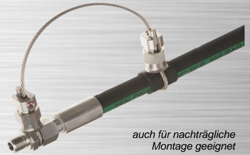
auch für nachträgliche Montage geeignet

Professionelle Schlauchfangsicherung aus 100% EDELSTAHL mit 3mm Edelstahldrahtseil und beiderseits zu öffnenden Edelstahl-Cablelock-Spannschlössern. Ausführung ASP3 ist geeignet für alle gängigen Hydraulikschläuche der Nennweiten DN5 bis DN16 und maßlich passend für die Schlauchtypen* 1SC, 2SC, 1SN, 2SN, 4SP, 4SH, R13, R15. DN16 druckmäßig nur bis 330bar max. also ca. 2SN/2SC (ab 4SP-DN16 siehe ASP4). Passend für alle Armaturentypen nach DIN EN 20066.