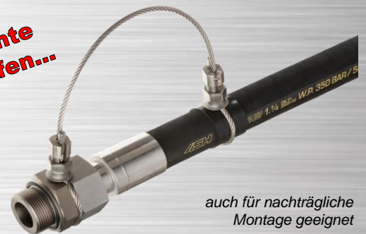
auch für nachträgliche Montage geeignet