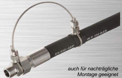
auch für nachträgliche Montage geeignet

Professionelle Schlauchfangsicherung aus 100% EDELSTAHL mit 4mm Edelstahldrahtseil und beiderseits zu öffnenden Edelstahl-Cablelock-Spannschlössern. Ausführung ASP4 ist geeignet für alle gängigen Hydraulikschläuche der Nennweiten DN16 bis DN50 und maßlich passend für die Schlauchtypen* 1SC, 2SC, 1SN, 2SN, 4SP, 4SH, R13, R15. DN25 druckmäßig nur bis 4SP; DN32 bis DN50 druckmäßig nur bis 2SN (bei höheren Drücken siehe ASP5). Passend für alle Armaturentypen nach DIN EN 20066.