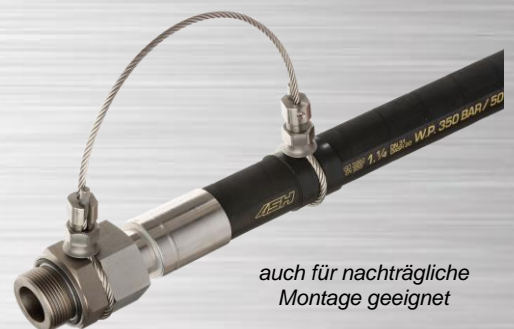
auch für nachträgliche Montage geeignet