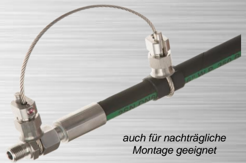
auch für nachträgliche Montage geeignet