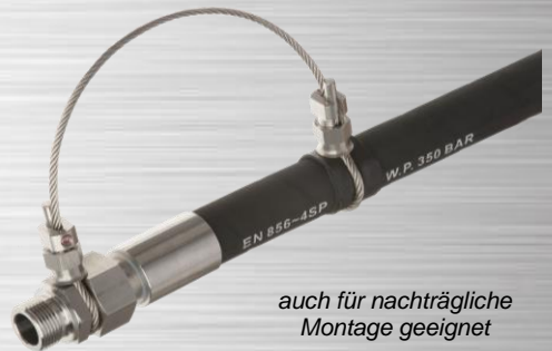
auch für nachträgliche Montage geeignet